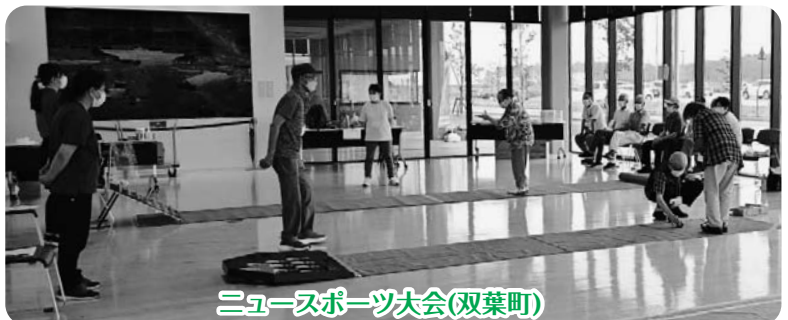
ニュースポーツ大会(双葉町)