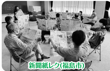
新聞紙レク(福島市)