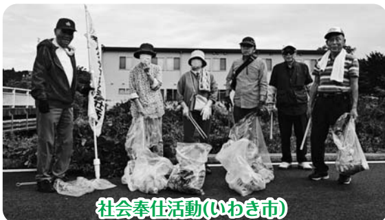
社会奉仕活動(いわき市)