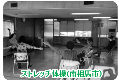
ストレッチ体操(南相馬市)