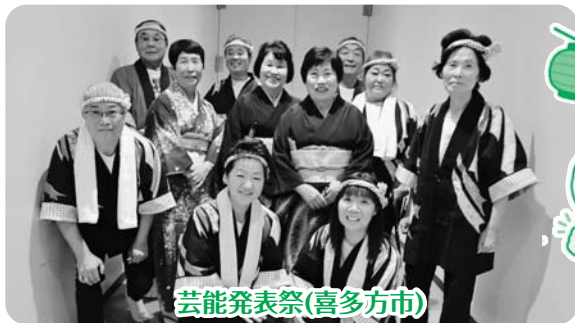
芸能発表祭(喜多方市)