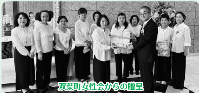
双葉町女性会からの贈呈