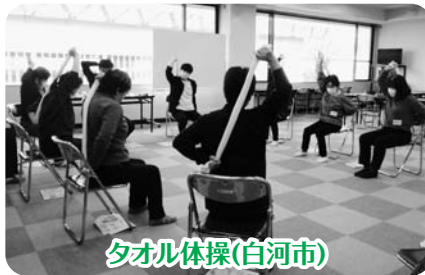
タオル体操(白河市)