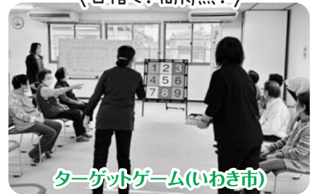
ターゲットゲーム(いわき市)