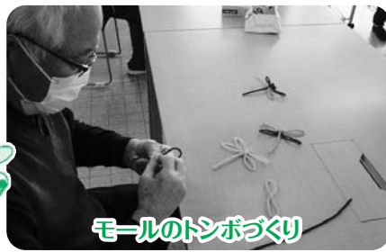
モールのトンボづくり