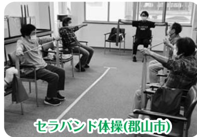
セラバンド体操(郡山市)